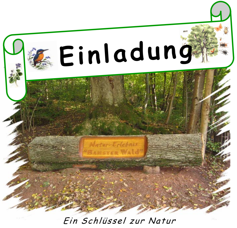
Ein Schlüssel zur Natur